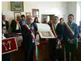
Sassuolo ad Irsina per Sant'Eufemia