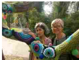
Villa Giacobazzi oggetto di un vero e proprio Yarn Bombing