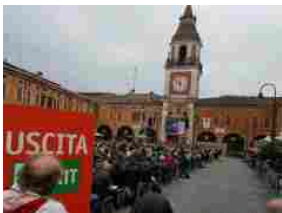
FestivalFilosofia: il programma di domani domenica 17/09 a Sassuolo